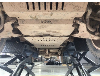
Motor, Alt muhafaza > Ezik