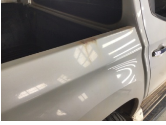
Çamurluk, sağ arka, Çamurluk, sağ arka > Pas