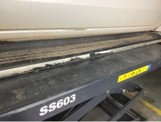
Marşbiyel, sol, Marşbiyel plastiği, sol > Çizik