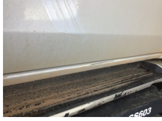
Marşbiyel, sağ, Marşbiyel, sağ > Çizik