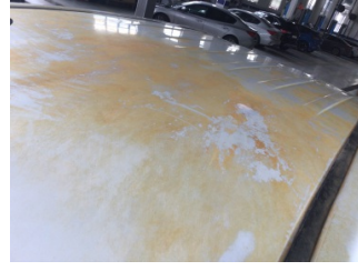
Tavan, Tavan > Pas