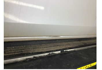
Marşbiyel, sol, Marşbiyel, sol > Çizik