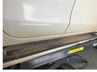
Marşbiyel, sağ, Marşbiyel plastiği, sağ > Çizik