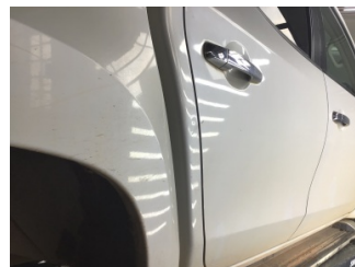
Kaporta, C-direk, sağ > Ezik