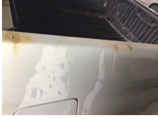
Çamurluk, sol arka, Çamurluk, sol arka > Pas