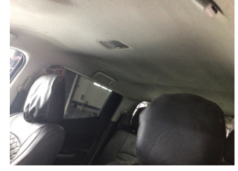
Döşemeler/Kapaklar, Tavan döşemesi > Kirlenmiş