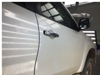
Kapı, sağ ön, Kapı, sağ ön > Ezik