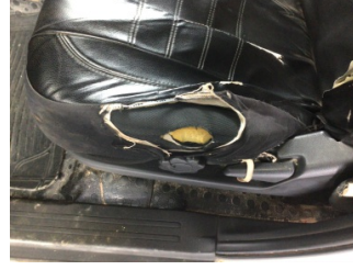
Koltuklar, ön, Koltuk, sol ön > Deforme Olmuş