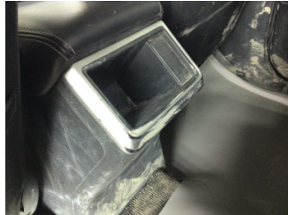
Döşemeler/Kapaklar, Döşemeler/Kapaklar > Çizik