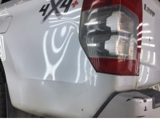
Çamurluk, sol arka, Çamurluk, sol arka > Hasarlı