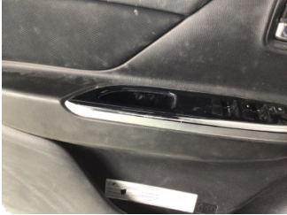
Döşemeler/Kapaklar, Kapı döşemesi, sol ön > Deforme Olmuş