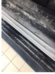
Marşbiyel, sol, Marşbiyel, sol > Boyası Atmış