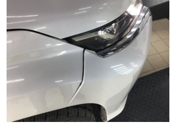
Tampon, ön, Ön tampon > Sabitlemesi Hatalı