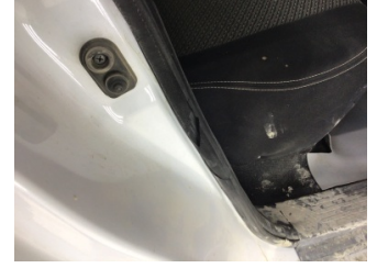
Kapı, sağ arka, Kapı fitili > Hasarlı