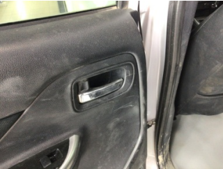
Döşemeler/Kapaklar, Döşemeler/Kapaklar > Çizik