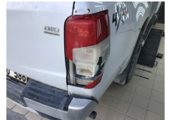
Arka lambalar, Arka lamba camı, sağ > Hasarlı