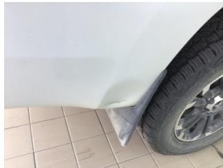
Çamurluk, sağ arka, Çamurluk, sağ arka > Hasarlı