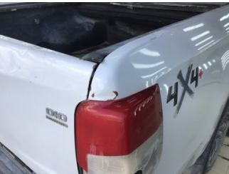
Çamurluk, sağ arka, Çamurluk, sağ arka > Hasarlı