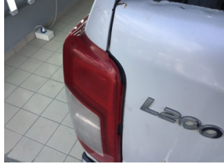
Arka lambalar, Arka lamba camı, sol > Hasarlı