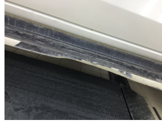
Marşbiyel, sağ, Marşbiyel plastiği, sağ > Hasarlı