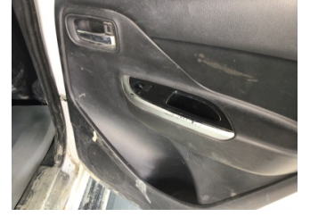
Döşemeler/Kapaklar, Kapı döşemesi, sağ arka > Deforme Olmuş