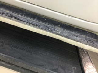
Marşbiyel, sol, Marşbiyel plastiği, sol > Hasarlı