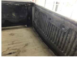
Döşemeler/Kapaklar, Bagaj bölümü döşemesi > Çizik