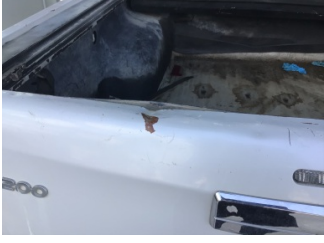
Bagaj kapağı/kapısı, Bagaj kapısı > Hasarlı

Sayfa: 9/10 Araç Çıkış Tarihi: 05.09.2024 13:47