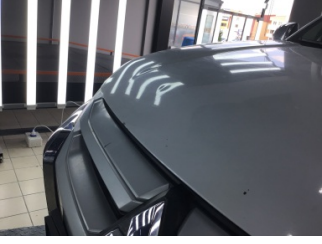
Motor kaputu, Motor kaputu > Ezik