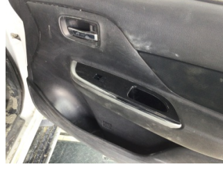
Döşemeler/Kapaklar, Kapı döşemesi, sağ ön > Deforme Olmuş