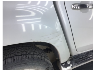
Çamurluk, sağ arka, Çamurluk, sağ arka > Hasarlı