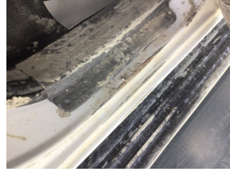
Marşbiyel, sağ, Marşbiyel, sağ > Boyası Atmış