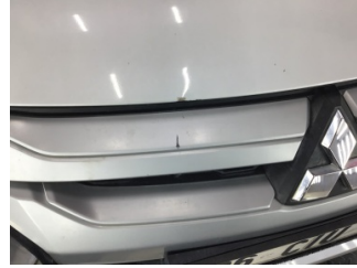
İlave parçalar, ön, Ön panjur > Çizik