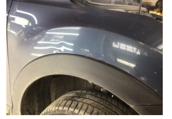
Çamurluk, sağ, Çamurluk, sağ > Ezik