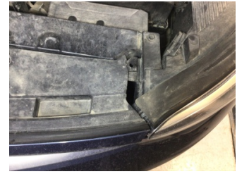
İlave parçalar, ön, Ön panjur > Hasarlı