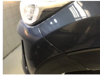
Tampon, ön, Ön tampon > Ayarsız