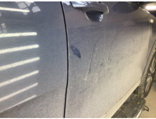
Kapı, sağ ön, Kapı, sağ ön > Noktasal Ezik