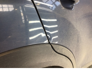
Kapı, sağ arka, Kapı, sağ arka > Ezik