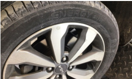
Jant, sol ön > Çizik