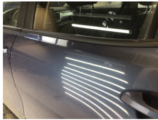
Kapı, sol arka, Kapı, sol arka > Noktasal Ezik