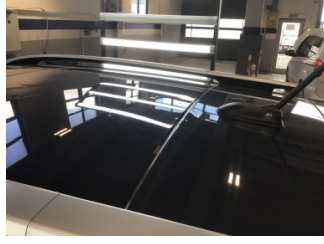
Tavan, Tavan > Ezik