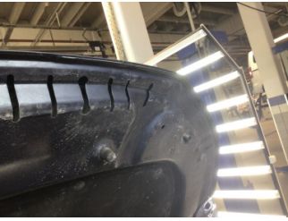
Motor kaputu, Motor kaputu > Standart Dışı Onarım