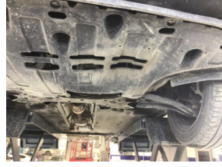
Motor, Alt muhafaza > Ezik