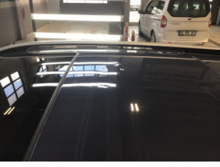
Tavan, Tavan > Ezik