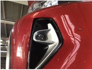
İlave lambalar, İlave lamba > Hasarlı