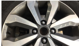
Jant göbeği kapağı, arka sağ > Sökülmüş-Yok