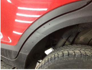
Çamurluk, sol arka, Çamurluk ağzı > Çizik