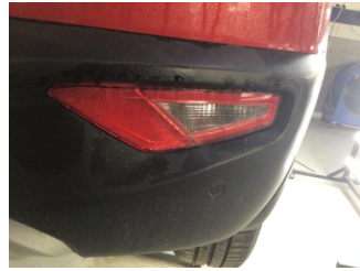
Tampon, arka, Reflektör, sağ > Hasarlı