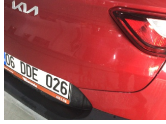
Bagaj kapağı/kapısı, Bagaj kapısı > Noktasal Ezik