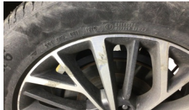
Lastik, sol arka > Çizik