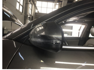
Dikiz aynası, sol, Dış dikiz aynası > Çizik