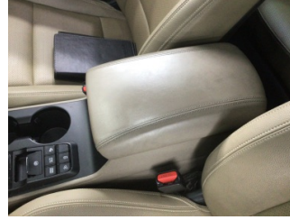
Döşemeler/Kapaklar, Kol dayaması, ön > Kirlenmiş