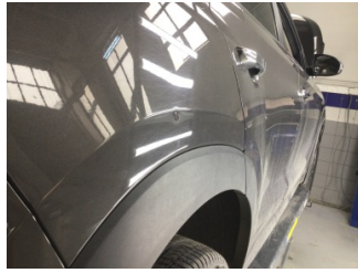
Çamurluk, sağ arka, Çamurluk, sağ arka > Noktasal Ezik