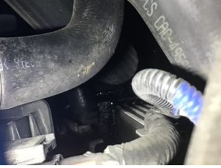
Motor, Turbo hortumları > Yağ Kaçağı