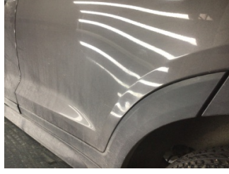
Kapı, sol arka, Kapı, sol arka > Ezik