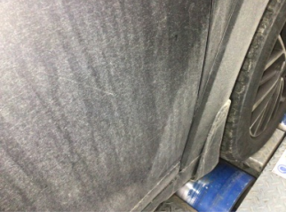
Kapı, sağ ön, Kapı, sağ ön > Ezik