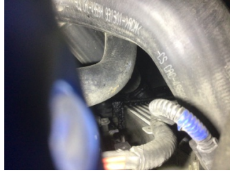
Motor, Turbo hava soğutucusu > Yağ Kaçağı