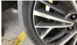
Lastik, sol arka > Çizik