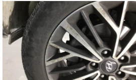
Jant, sol ön > Çizik