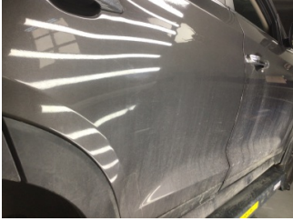
Kapı, sağ arka, Kapı, sağ arka > Çizik