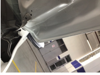
Motor kaputu, Motor kaputu > Standart Dışı Onarım

Sayfa: 9/11 Araç Çıkış Tarihi: 20.09.2024 14:11