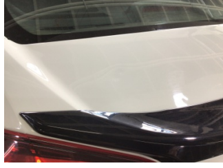
Bagaj kapağı/kapısı, Bagaj kapısı > Ezik