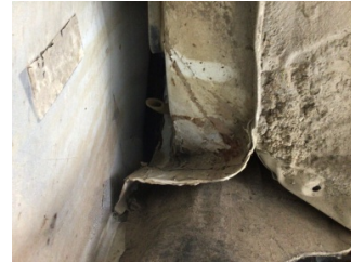
Çamurluk, sol arka, Çamurluk, sol arka > Standart Dışı Onarım