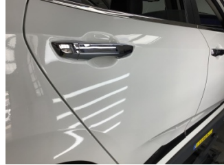
Kapı, sağ arka, Kapı, sağ arka > Çizik