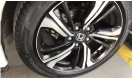
Jant, sağ arka > Çizik