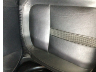
Koltuklar, ön, Koltuk, sağ ön > Deforme Olmuş