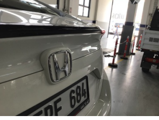
Bagaj kapağı/kapısı, Bagaj kapısı > Ezik