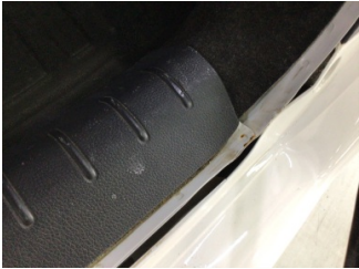
Arka bölüm, Arka sac/panel > Hasarlı