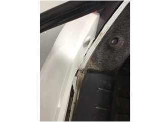
Arka bölüm, Arka sac/panel > Standart Dışı Onarım