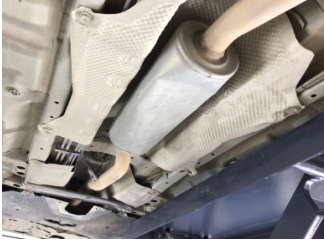
Egzoz sistemi, Orta susturucu > Hasarlı