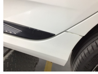
Marşbiyel, sol, Marşbiyel plastiği, sol > Standart Dışı Onarım