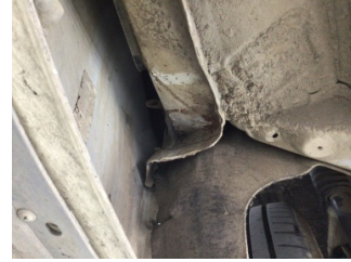
Çamurluk, sol arka, Çamurluk, sol arka > Hasarlı