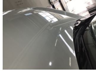
Motor kaputu, Motor kaputu > Ezik