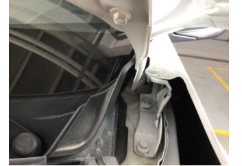
Motor kaputu, Mentşe > Standart Dışı Onarım