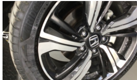
Jant, sağ ön > Çizik