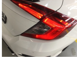
Arka lambalar, Arka lambalar, sağ > Hasarlı