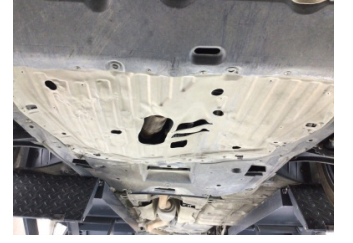
Motor, Alt muhafaza > Hasarlı