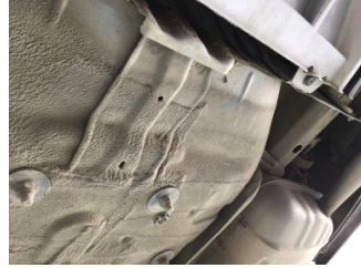
Arka bölüm, Bagaj havuzu > Hasarlı