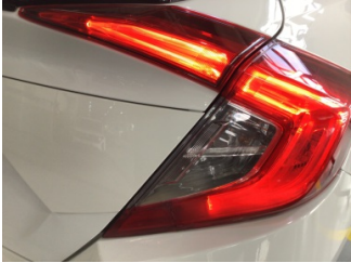
Arka lambalar, Arka lambalar, sağ > Hasarlı