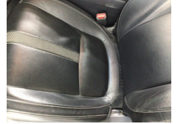
Koltuklar, ön, Koltuk, sol ön > Deforme Olmuş