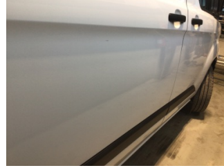
Kapı, sağ arka, Kapı, sağ arka > Çizik