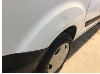
Çamurluk, sağ arka, Çamurluk, sağ arka > Çizik