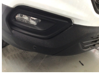
Tampon, ön, Ön tampon ızgarası > Ayarsız