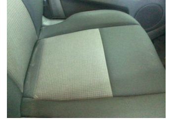
Koltuklar, ön, Koltuk, sol ön > Kirlenmiş