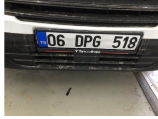
Tampon, ön, Ön tampon > Hasarlı