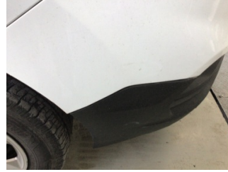
Tampon, ön, Ön tampon > Çizik