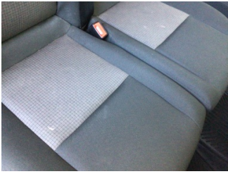
Koltuklar, ön, Koltuk, sağ ön > Kirlenmiş