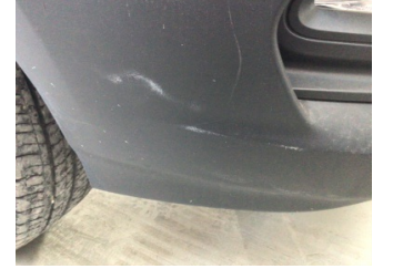
Tampon, ön, Ön tampon > Çizik