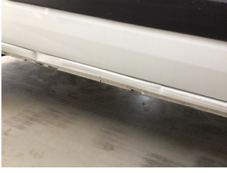
Marşbiyel, sağ, Marşbiyel, sağ > Ezik