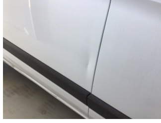
Kapı, sağ arka, Kapı, sağ arka > Ezik