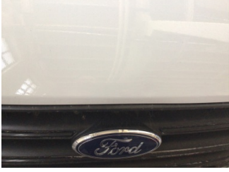
Motor kaputu, Motor kaputu > Noktasal Ezik