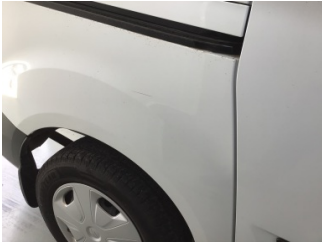
Çamurluk, sağ arka, Çamurluk, sağ arka > Çizik