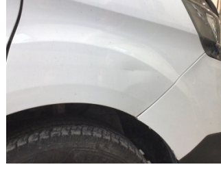
Çamurluk, sağ, Çamurluk, sağ > Ezik