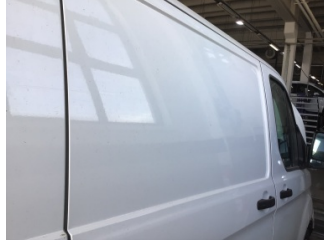
Kapı, sağ arka, Kapı, sağ arka > Çizik