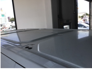
Tavan, Tavan > Çizik