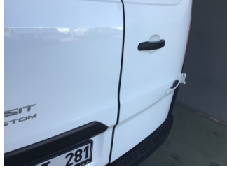
Bagaj kapağı/kapısı, Bagaj kapısı, sağ > Ayarsız