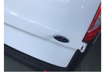
Bagaj kapağı/kapısı, Bagaj kapısı, sağ > Hasarlı