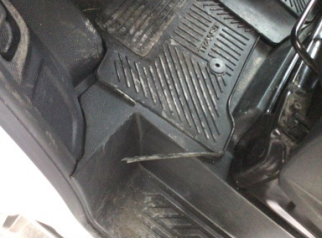
Taban, Paspaslar > Deforme Olmuş