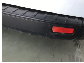
Tampon, arka, Reflektör, sağ > Hasarlı