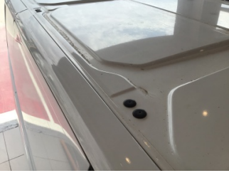
Tavan, Tavan > Çizik