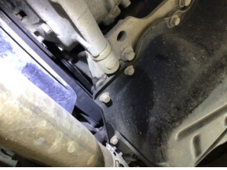
Motor, Triger zinciri kapağı > Yağ Kaçağı