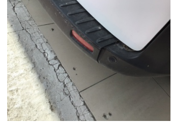
Tampon, arka, Arka tampon > Ayarsız