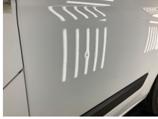
Çamurluk, sol arka, Çamurluk, sol arka > Noktasal Ezik