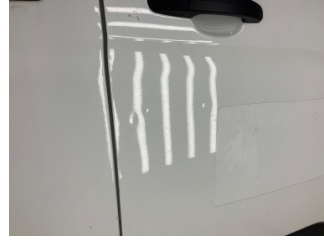
Kapı, sağ ön, Kapı, sağ ön > Noktasal Ezik