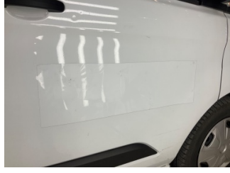
Kapı, sağ ön, Kapı, sağ ön > Etiket Yapıştırılmış