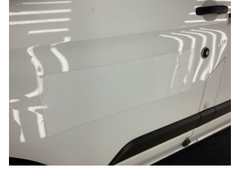
Kapı, sol ön, Kapı, sol ön > Etiket Yapıştırılmış