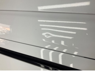
Çamurluk, sağ arka, Çamurluk, sağ arka > Noktasal Ezik