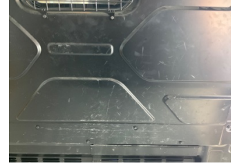
Döşemeler/Kapaklar, Bagaj bölümü döşemesi > Çizik