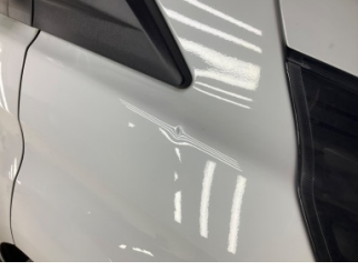
Çamurluk, sağ, Çamurluk, sağ > Noktasal Ezik