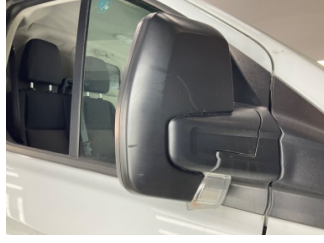
Dikiz aynası, sağ, Dış dikiz aynası kapağı > Çizik