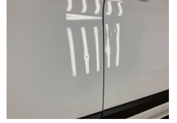
Kapı, sağ arka, Kapı, sağ arka > Noktasal Ezik