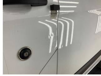
Kapı, sol ön, Kapı, sol ön > Noktasal Ezik