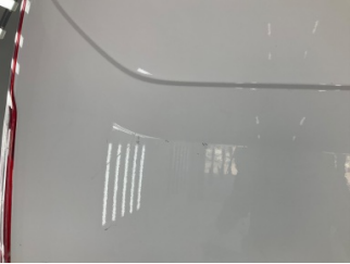
Bagaj kapağı/kapısı, Bagaj kapısı > Çizik