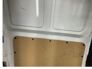
Döşemeler/Kapaklar, Bagaj bölümü döşemesi > Çizik