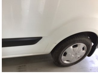
Çamurluk, sol arka, Çamurluk, sol arka > Çizik