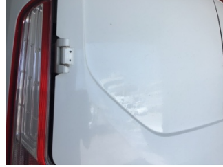
Bagaj kapağı/kapısı, Bagaj kapısı, sol > Çizik