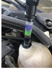
Motor, Silindir kapağı contası > Test Sonucu