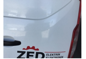
Bagaj kapağı/kapısı, Bagaj kapısı, sağ > Çizik