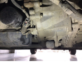
Şanzıman, Şanzıman > Yağ Kaçağı