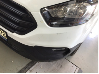
Tampon, ön, Ön tampon > Çizik