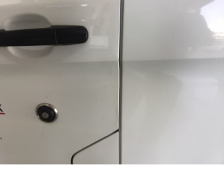
Kapı, sol ön, Kapı, sol ön > Ezik