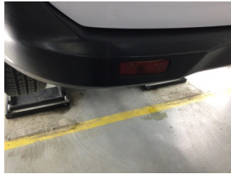
Tampon, arka, Reflektör, sol > Hasarlı