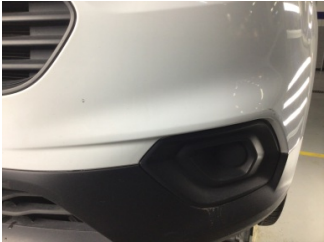
Tampon, ön, Ön tampon > Çizik