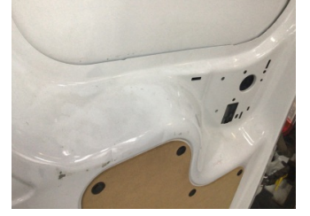
Bagaj kapağı/kapısı, Bagaj kapısı, sol > Ezik