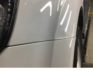
Çamurluk, sol, Çamurluk, sol > Ezik