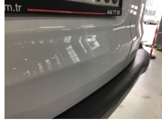
Bagaj kapağı/kapısı, Bagaj kapısı, sol > Ezik