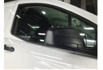
Dikiz aynası, sağ, Dış dikiz aynası > Çizik