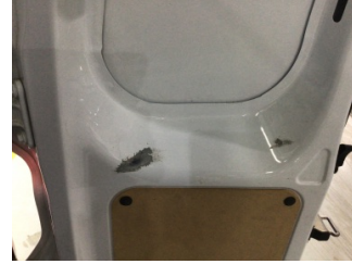
Bagaj kapağı/kapısı, Bagaj kapısı, sağ > Çizik