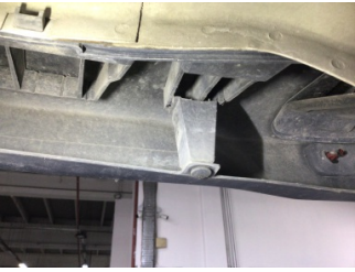
Tampon, arka, Bağlantı ayağı > Hasarlı