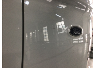
Bagaj kapağı/kapısı, Bagaj kapısı, sağ > Çizik