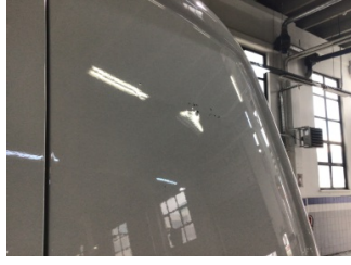
Bagaj kapağı/kapısı, Bagaj kapısı, sağ > Ezik