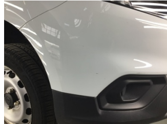
Tampon, ön, Ön tampon > Çizik