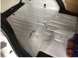
Arka bölüm, Bagaj havuzu > Çizik