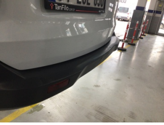
Tampon, arka, Arka tampon > Ezik