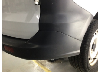
Tampon, arka, Arka tampon > Ezik