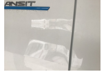
Bagaj kapağı/kapısı, Bagaj kapısı, sol > Hasarlı