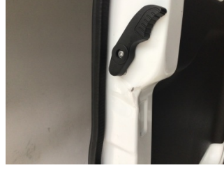
Bagaj kapağı/kapısı, Bagaj kapısı, sol > Hasarlı