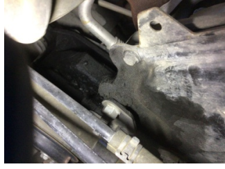
Motor, Triger zinciri kapağı > Yağ Kaçağı