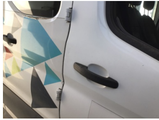
Kapı, sağ ön, Kapı, sağ ön > Noktasal Ezik