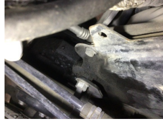
Motor, Triger zinciri kapağı > Yağ Kaçağı