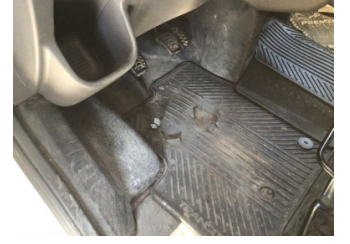
Taban, Paspaslar > Deforme Olmuş