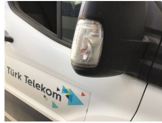
Dikiz aynası, sağ, Sinyal lambası > Hasarlı