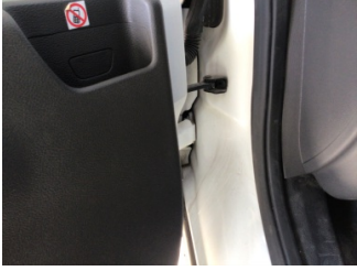
Kapı, sol ön, Kapı gergisi > Ses Yapıyor