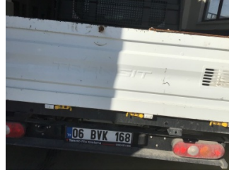
Bagaj kapağı/kapısı, Bagaj kapısı > Çizik