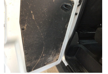
Döşemeler/Kapaklar, Kapı döşemesi, sol arka > Deforme Olmuş