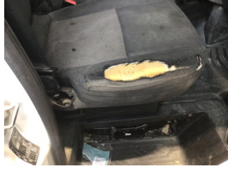
Koltuklar, ön, Koltuk, sağ ön > Hasarlı