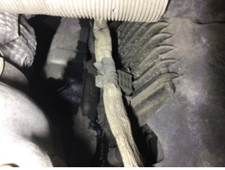
Motor, Motor üst kapağı, plastik > Yağ Kaçağı