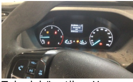
Tekerlek/Lastik > Uyarı Lambası Yanıyor