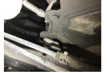
Motor, Triger zinciri > Yağ Kaçağı