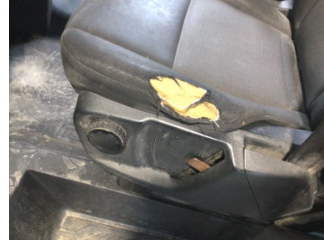
Koltuklar, ön, Koltuk, sol ön > Hasarlı