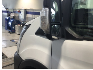
Dikiz aynası, sol, Sinyal lambası > Hasarlı