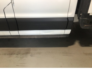
Kapı, sol arka, Kapı, sol arka > Hasarlı