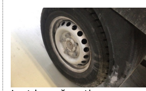
Jant kapağı seti > Sökülmüş-Yok