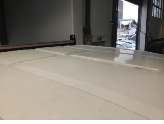
Tavan, Tavan > Ezik