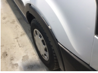
Çamurluk, sağ, Çamurluk ağızı > Hasarlı