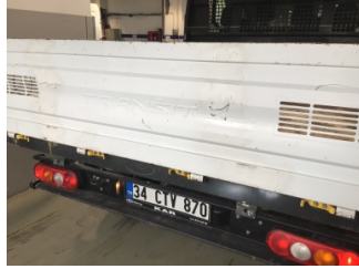
Bagaj kapağı/kapısı, Bagaj kapısı > Çizik