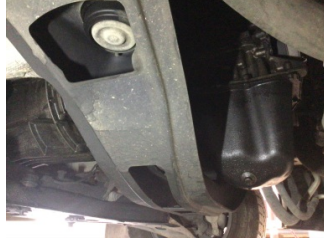
Motor, Yağ karteri > Yağ Kaçağı