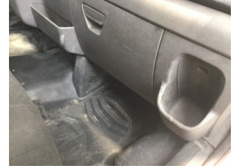
Pano/Göstergeler, Ön Torpido > Çizik