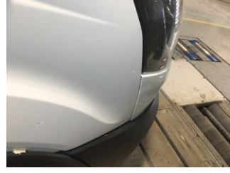
İlave parçalar, ön, Ön panjur > Ayarsız