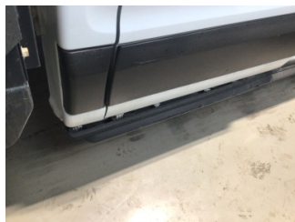
Marşbiyel, sağ, Marşbiyel plastiği, sağ > Hasarlı