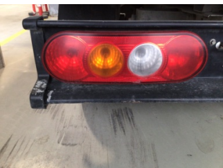
Arka lambalar, Arka lambalar, sol > Hasarlı