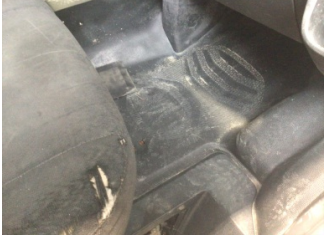
Taban, Paspaslar > Sökülmüş-Yok

Sayfa: 11/12 Araç Çıkış Tarihi: 05.02.2025 15:11