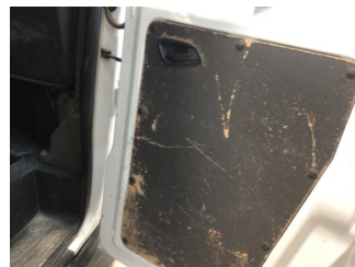
Döşemeler/Kapaklar, Kapı döşemesi, sağ arka > Deforme Olmuş