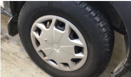
Jant kapağı seti > Hasarlı