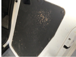
Döşemeler/Kapaklar, Kapı döşemesi, sağ arka > Deforme Olmuş