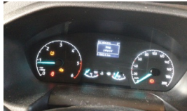
Tekerlek/Lastik > Uyarı Lambası Yanıyor