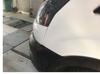
İlave parçalar, ön, Ön panjur > Ayarsız