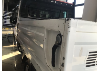
Çamurluk, sol arka, Çamurluk, sol arka > Çizik