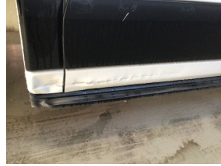
Kapı, sağ arka, Kapı, sağ arka > Hasarlı