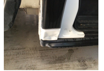
Kaporta, C-direk, sağ > Hasarlı