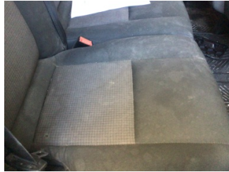
Koltuklar, ön, Koltuk, sağ ön > Kirlenmiş