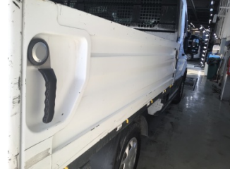
Çamurluk, sağ arka, Çamurluk, sağ arka > Çizik