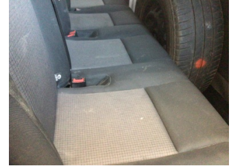
Koltuklar, arka, Arka koltuk > Kirlenmiş