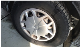
Jant kapağı seti > Hasarlı