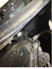
Motor, Triger zinciri kapağı > Yağ Kaçağı

Sayfa: 9/11 Araç Çıkış Tarihi: 18.12.2024 11:06