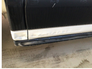
Kapı, sağ arka, Kapı, sağ arka > Standart Dışı Onarım