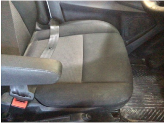
Koltuklar, ön, Koltuk, sol ön > Kirlenmiş