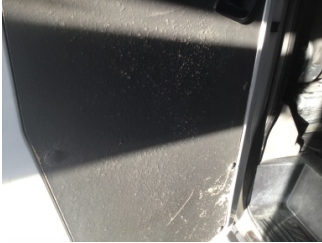
Döşemeler/Kapaklar, Kapı döşemesi, sol arka > Deforme Olmuş