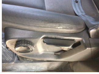
Koltuklar, ön, Koltuk, sol ön > Deforme Olmuş