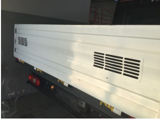
Bagaj kapağı/kapısı, Bagaj kapısı > Çizik