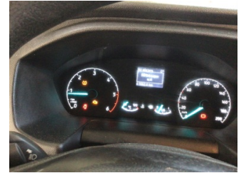
Motor, Motor > Uyarı Lambası Yanıyor