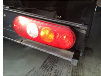
Arka lambalar, Arka lambalar, sağ > Hasarlı