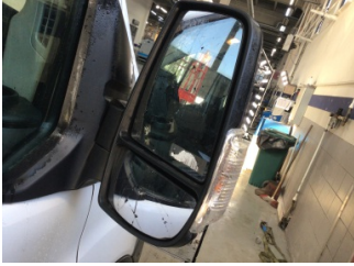
Dikiz aynası, sağ, Dış dikiz aynası > Hasarlı