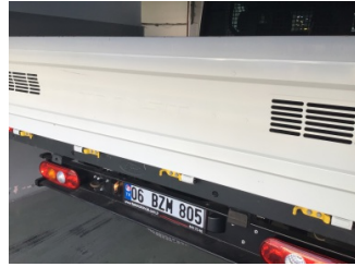
Bagaj kapağı/kapısı, Bagaj kapısı > Çizik