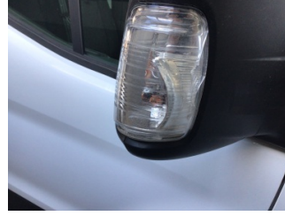
Dikiz aynası, sağ, Sinyal lambası > Hasarlı