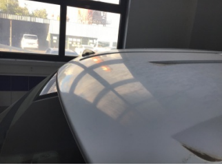
Tavan, Tavan > Noktasal Ezik