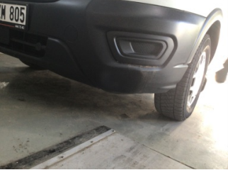
Tampon, ön, Ön tampon > Ezik