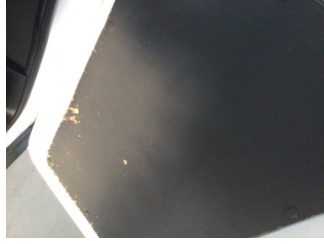
Döşemeler/Kapaklar, Kapı döşemesi, sağ arka > Deforme Olmuş