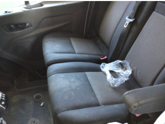
Döşemeler/Kapaklar, Döşemeler/Kapaklar > Hasarlı