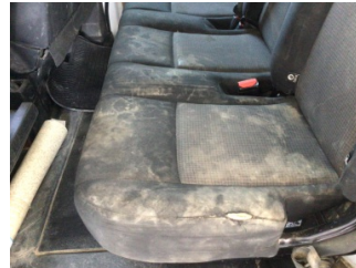
Döşemeler/Kapaklar, Döşemeler/Kapaklar > Hasarlı