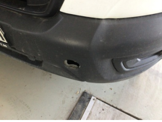
Tampon, ön, Çeki demir kapağı > Sökülmüş-Yok