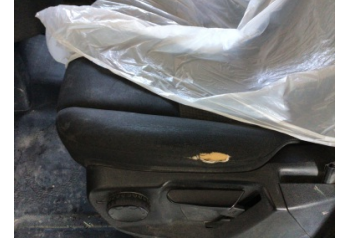
Döşemeler/Kapaklar, Döşemeler/Kapaklar > Hasarlı