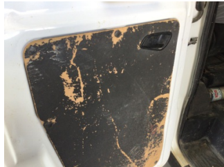
Döşemeler/Kapaklar, Döşemeler/Kapaklar > Hasarlı