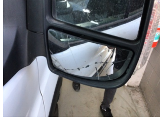
Dikiz aynası, sağ, Ayna camı > Hasarlı