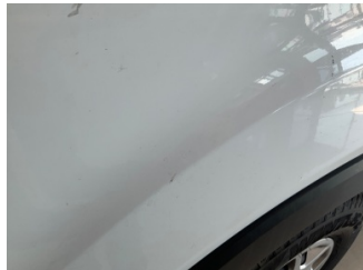
Çamurluk, sol, Çamurluk, sol > Taş izi