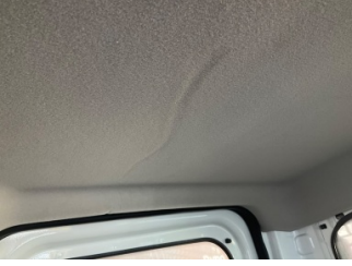
Döşemeler/Kapaklar, Tavan döşemesi > Deforme Olmuş