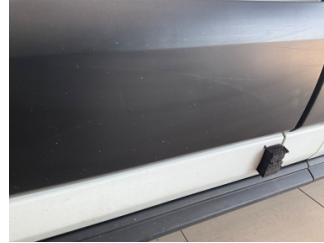
Kapı, sol ön, Nikelaj, alt > Çizik