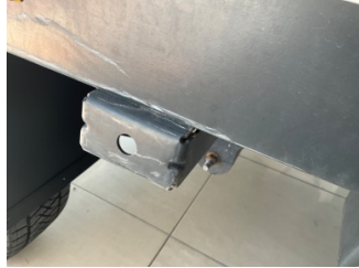
Çamurluk, sağ arka, Çamurluk, sağ arka > Eksik