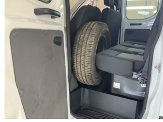
Döşemeler/Kapaklar, Döşemeler/Kapaklar > Yüzeysel Çizik