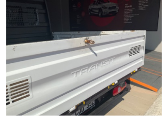
Bagaj kapağı/kapısı, Bagaj kapısı > Çizik