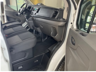
Döşemeler/Kapaklar, Döşemeler/Kapaklar > Yüzeysel Çizik