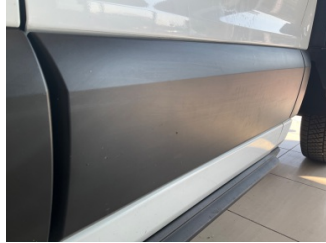
Kapı, sol arka, Nikelaj, alt > Çizik