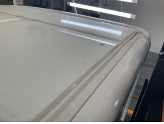
Tavan, Tavan > Yakıcı Madde İle Zarar Görmüş