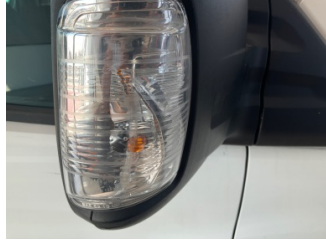
Dikiz aynası, sağ, Sinyal lambası > Çizik