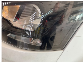
Farlar, Far camı, sol > Çizik