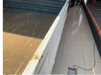
Çamurluk, sağ arka, Çamurluk, sağ arka > Pas