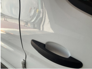
Kapı, sağ ön, Kapı, sağ ön > Yüzeysel Çizik