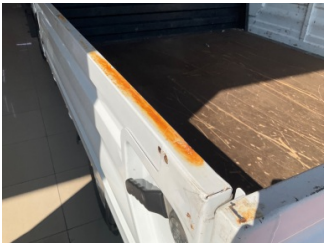
Çamurluk, sol arka, Çamurluk, sol arka > Pas