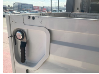
Çamurluk, sağ arka, Çamurluk, sağ arka > Çizik