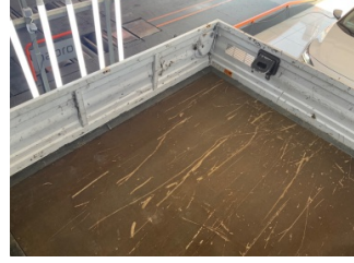
Döşemeler/Kapaklar, Bagaj bölümü döşemesi > Çizik