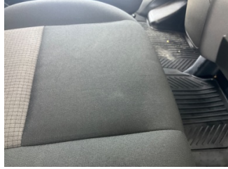
Döşemeler/Kapaklar, Döşemeler/Kapaklar > Yüzeysel Çizik