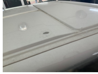
Tavan, Tavan > Boyası Atmış