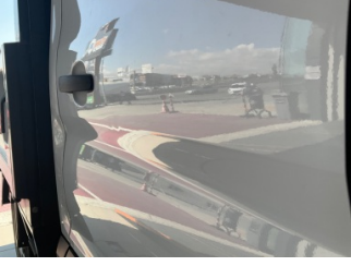
Kapı, sağ arka, Kapı, sağ arka > Ezik