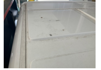
Tavan, Tavan > Boyası Atmış