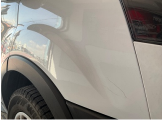
Çamurluk, sağ, Çamurluk, sağ > Çizik