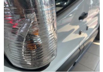
Dikiz aynası, sol, Sinyal lambası > Çizik