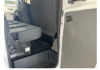
Döşemeler/Kapaklar, Döşemeler/Kapaklar > Yüzeysel Çizik