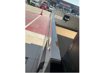
Çamurluk, sağ arka, Çamurluk, sağ arka > Pas