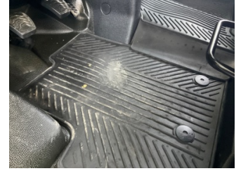
Taban, Paspaslar > Deforme Olmuş