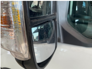
Dikiz aynası, sol, Dış dikiz aynası kapağı > Çizik