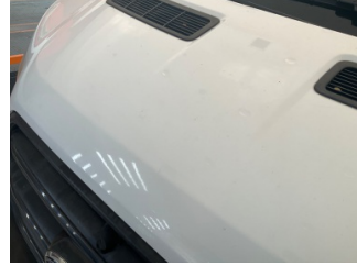
Motor kaputu, Motor kaputu > Taş izi