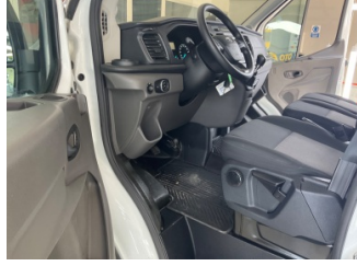
Döşemeler/Kapaklar, Döşemeler/Kapaklar > Yüzeysel Çizik