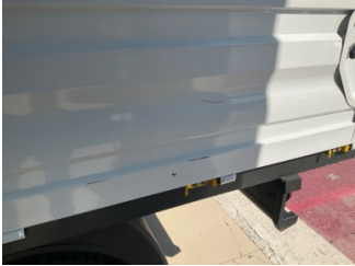
Çamurluk, sol arka, Çamurluk, sol arka > Çizik