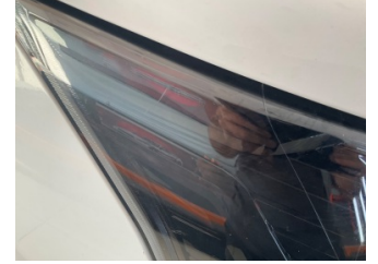
Farlar, Far camı, sağ > Küçük Çizik