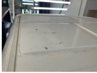
Tavan, Tavan > Yakıcı Madde İle Zarar Görmüş