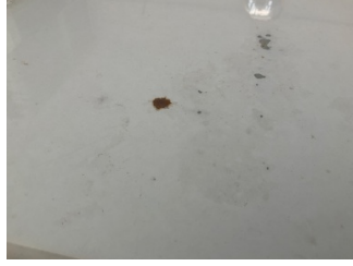
Tavan, Tavan > Pas