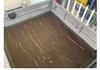
Döşemeler/Kapaklar, Bagaj bölümü döşemesi > Çizik