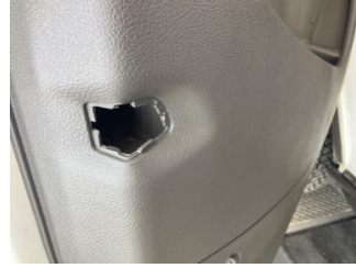
Döşemeler/Kapaklar, Kapı döşemesi, sol ön > Eksik