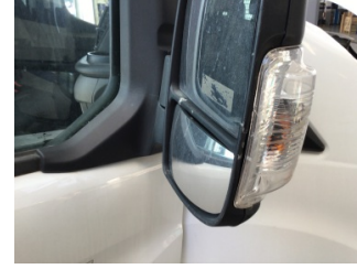
Dikiz aynası, sağ, Sinyal lambası > Hasarlı