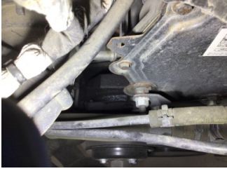
Motor, Triger zinciri kapağı > Yağ Kaçağı