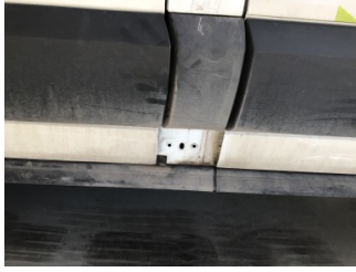
Motor, Yakıt deposu bağlantısı > Sökülmüş-Yok