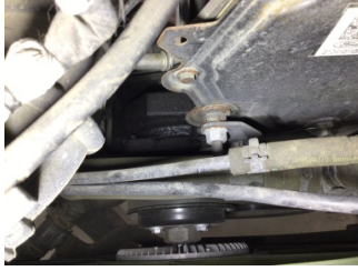
Motor, Triger zinciri kapağı > Yağ Kaçağı