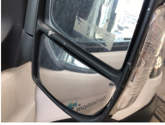
Dikiz aynası, sağ, Dış dikiz aynası > Hasarlı