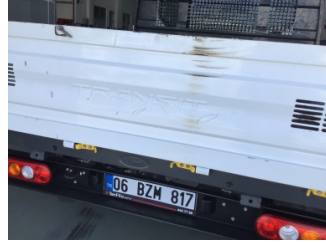
Bagaj kapağı/kapısı, Bagaj kapısı > Çizik