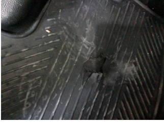
Taban, Paspaslar > Deforme Olmuş