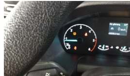
Tekerlek/Lastik > Uyarı Lambası Yanıyor