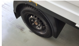
Jant kapağı seti > Sökülmüş-Yok