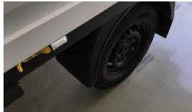
Jant kapağı seti > Sökülmüş-Yok