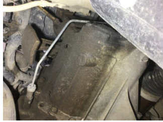
Şanzıman, Şanzıman > Yağ Kaçağı