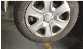
Jant kapağı seti > Çizik