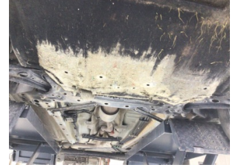
Motor, Alt muhafaza > Hasarlı