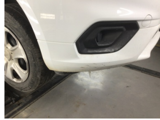
Tampon, ön, Ön tampon > Çizik