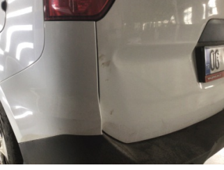
Bagaj kapağı/kapısı, Bagaj kapısı > Ezik