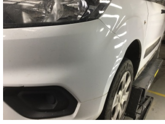
Tampon, ön, Ön tampon > Ezik