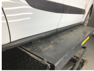
Marşbiyel, sağ, Marşbiyel plastığı, sağ > Çizik