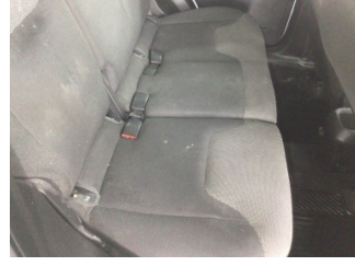
Koltuklar, arka, Arka koltuk > Kirlenmiş