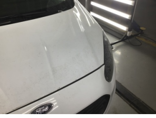
Tampon, ön, Ön tampon > Ayarsız

Sayfa: 9/10 Araç Çıkış Tarihi: 28.02.2025 13:25