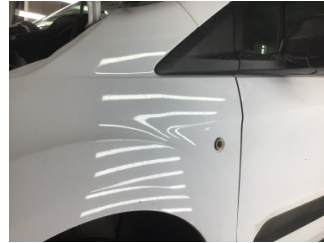
İlave sinyal lambaları, ilave sinyal lambası, sol ön > Hasarlı