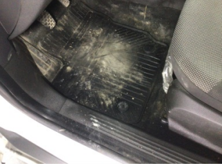
Taban, Taban halısı > Kirlenmiş