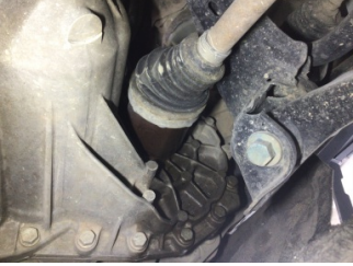
Ön aks, Aks mili, sol > Yağ Kaçağı