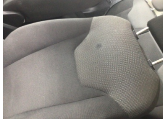
Koltuklar, ön, Koltuk, sol ön > Deforme Olmuş