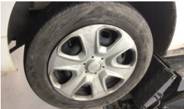
Jant kapağı seti > Çizik