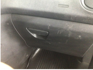
Pano/Göstergeler, Ön Torpido > Çizik