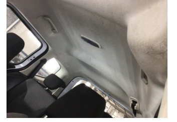
Döşemeler/Kapaklar, Tavan döşemesi > Deforme Olmuş