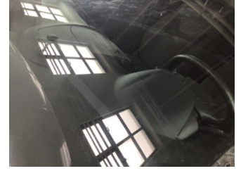
Camlar, Ön cam > Taş İzi