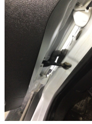
Kapı, sol ön, Kapı gergisi > Ses Yapıyor