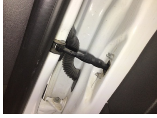
Kapı, sağ ön, Kapı gergisi > Ses Yapıyor