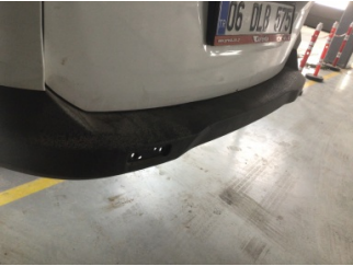
Tampon, arka, Arka tampon > Hasarlı