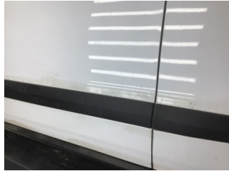
Kapı, sol ön, Kapı, sol ön > Noktasal Ezik