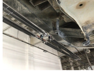
Tampon, arka, Bağlantı ayağı > Hasarlı