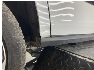
Çamurluk, sağ arka, Çamurluk, sağ arka > Hasarlı