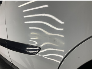
Kapı, sol arka, Kapı, sol arka > Standart Dışı Onarım