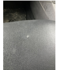
Koltuklar, ön, Koltuk döşemesi, sol ön > Yakıcı Madde ile Zarar Görmüş