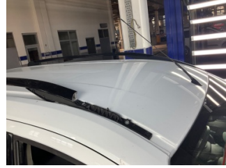
Tavan, Port bagaj demiri > Hasarlı