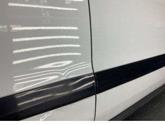
Kapı, sağ arka, Kapı, sağ arka > Ezik