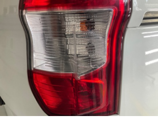
Arka lambalar, Arka lamba camı, sağ > Hasarlı