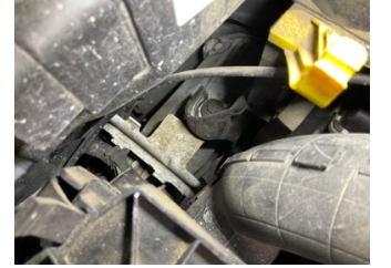
Kaporta, Ön Panel > Sabitlemesi Hatalı