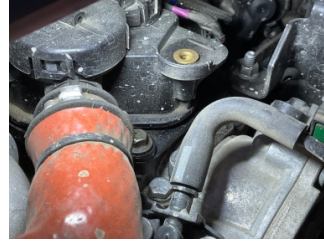
Motor, Motor üst kapağı, plastik > Yağ Kaçağı