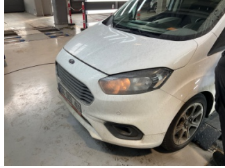
Tampon, ön, Ön tampon > Ayarsız