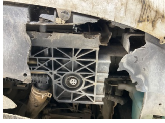
Kaporta, Ön Panel > Hasarlı