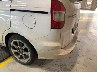
Tampon, arka, Arka tampon > Ayarsız