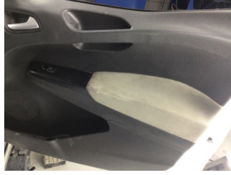
Döşemeler/Kapaklar, Kapı döşemesi, sağ ön > Kirlenmiş