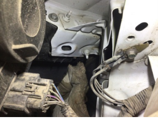
Çamurluk, sağ, Bağlantı ayağı > Ezik