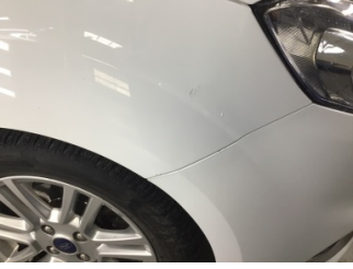
Çamurluk, sağ, Çamurluk, sağ > Standart Dışı Onarım