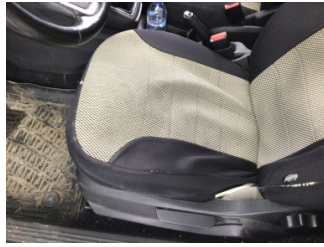
Koltuklar, ön, Koltuk, sol ön > Deforme Olmuş