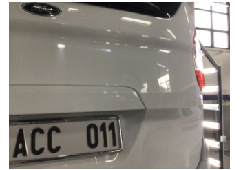
Bagaj kapağı/kapısı, Bagaj kapısı > Hasarlı