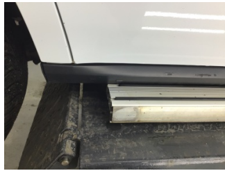
Marşbiyel, sağ, Marşbiyel plastığı, sağ > Sökülmüş-Yok