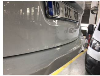
Bagaj kapağı/kapısı, Bagaj kapısı > Hasarlı