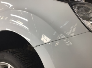
Çamurluk, sağ, Çamurluk, sağ > Çizik