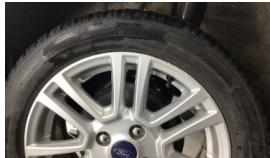
Jant, sol arka > Çizik