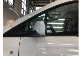
Dikiz aynası, sol, Dış dikiz aynası > Çizik