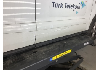
Kapı, sağ ön, Kapı, sağ ön > Ezik