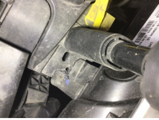
Farlar, Far bağlantı ayağı, sol > Hasarlı