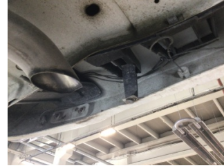
Tampon, arka, Bağlantı ayağı > Hasarlı