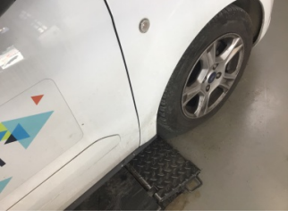
Çamurluk, sağ, Çamurluk, sağ > Ezik