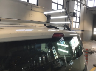
Bagaj kapağı/kapısı, Bagaj kapısı > Çizik