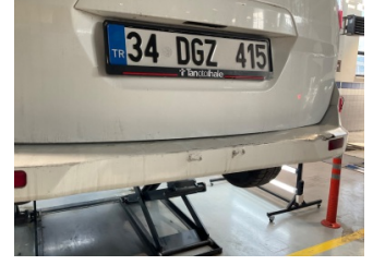
Tampon, arka, Arka tampon > Hasarlı