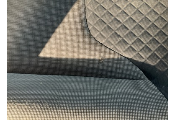
Koltuklar, ön, Koltuk döşemesi, sağ ön > Hasarlı