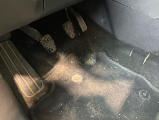
Taban, Taban halısı > Deforme Olmuş