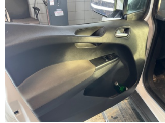
Döşemeler/Kapaklar, Döşemeler/Kapaklar > Deforme Olmuş