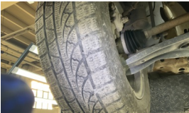
Lastik, sağ ön > Deforme Olmuş