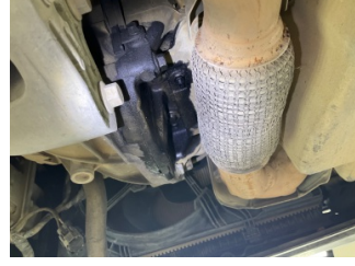
Motor, Motor > Yağ Kaçağı