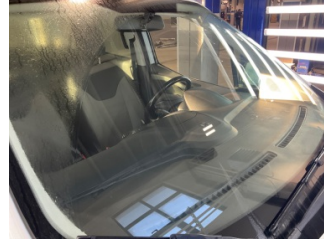
Camlar, Ön cam > Taş İzi