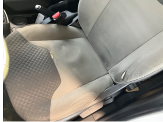
Koltuklar, ön, Koltuk döşemesi, sol ön > Hasarlı