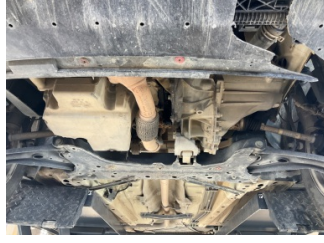
Motor, Alt muhafaza > Eksik