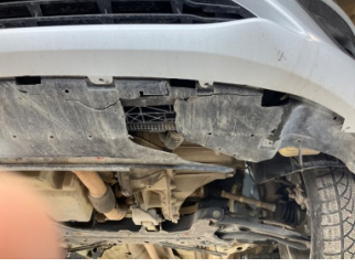
Motor, Alt muhafaza > Hasarlı

Sayfa: 8/9 Araç Çıkış Tarihi: 30.01.2025 09:47