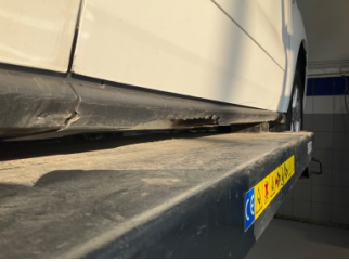
Marşbiyel, sağ, Marşbiyel plastiği, sağ > Hasarlı