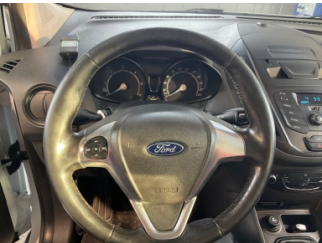
Direksiyon sistemi, Direksiyon simidi > Deforme Olmuş