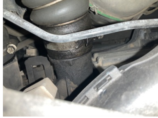
Motor, Turbo hortumları > Yağ Kaçağı