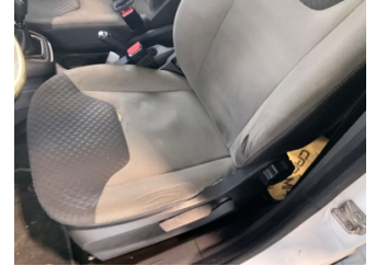
Döşemeler/Kapaklar, Döşemeler/Kapaklar > Deforme Olmuş