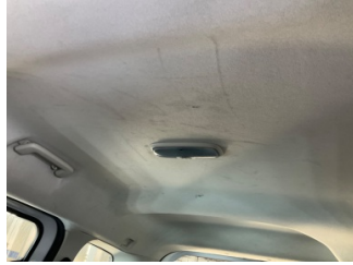
Döşemeler/Kapaklar, Döşemeler/Kapaklar > Çizik