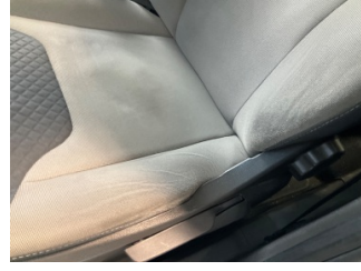
Döşemeler/Kapaklar, Döşemeler/Kapaklar > Deforme Olmuş