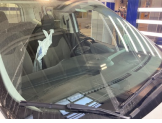
Camlar, Ön cam > Taş izi