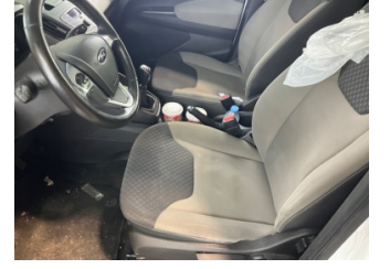
Döşemeler/Kapaklar, Döşemeler/Kapaklar > Kirlenmiş