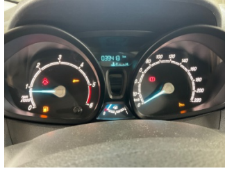
Motor, Motor > Uyarı Lambası Yanıyor