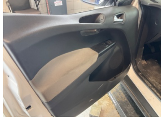
Döşemeler/Kapaklar, Döşemeler/Kapaklar > Deforme Olmuş