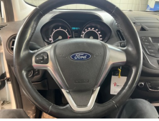
Direksiyon sistemi, Direksiyon simidi > Deforme Olmuş