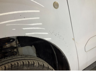
Çamurluk, sol, Çamurluk, sol > Boyası Atmış

Sayfa: 9/10 Araç Çıkış Tarihi: 30.01.2025 16:29