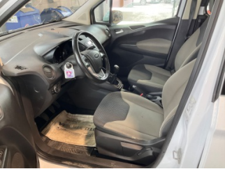
Döşemeler/Kapaklar, Döşemeler/Kapaklar > Kirlenmiş