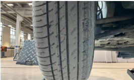
Tekerlek seti > Deforme Olmuş