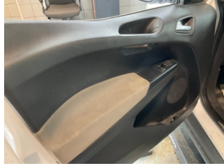
Döşemeler/Kapaklar, Döşemeler/Kapaklar > Deforme Olmuş