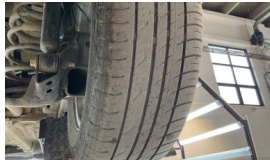
Tekerlek seti > Deforme Olmuş