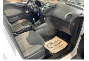
Döşemeler/Kapaklar, Döşemeler/Kapaklar > Deforme Olmuş