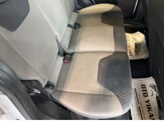
Döşemeler/Kapaklar, Döşemeler/Kapaklar > Hasarlı