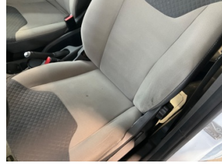
Döşemeler/Kapaklar, Döşemeler/Kapaklar > Hasarlı