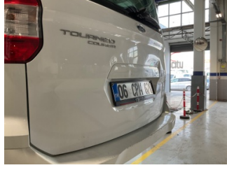
Bagaj kapağı/kapısı, Bagaj kapısı > Hasarlı