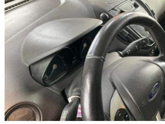
Döşemeler/Kapaklar, Döşemeler/Kapaklar > Deforme Olmuş