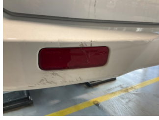
Arka lambalar, Arka lamba camı, sol > Çatlak