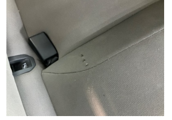
Koltuklar, arka, Arka koltuk döşemesi > Hasarlı