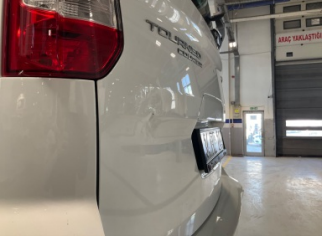
Bagaj kapağı/kapısı, Bagaj kapısı > Hasarlı