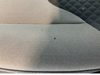
Koltuklar, ön, Koltuk döşemesi, sağ ön > Yakıcı Madde Ile Zarar Görmüş