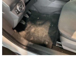
Taban, Paspaslar > Eksik