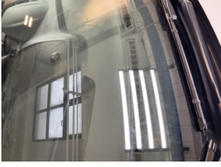
Camlar, Ön cam > Taş izi