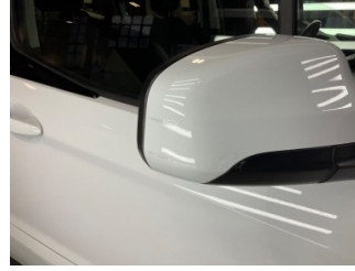
Dikiz aynası, sağ, Dış dikiz aynası > Rötüş