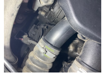
Motor, Triger zinciri kapağı > Yağ Kaçağı