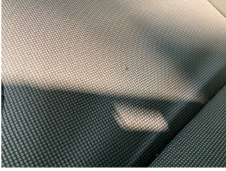
Koltuklar, arka, Arka koltuk döşemesi > Yakıcı Madde ile Zarar Görmüş