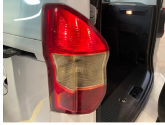
Arka lambalar, Arka lambalar, sol > Deforme Olmuş