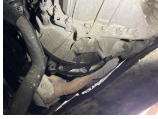
Motor, Yağ karteri > Yağ Kaçağı