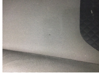
Koltuklar, ön, Koltuk, sağ ön > Hasarlı