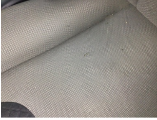
Koltuklar, ön, Koltuk, sol ön > Hasarlı