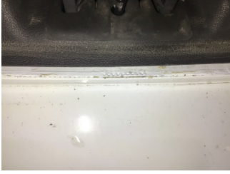
Arka bölüm, Arka sac/panel > Standart Dışı Onarım