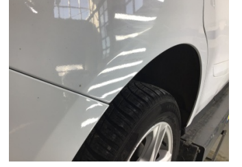
Çamurluk, sağ arka, Çamurluk ağı > Çizik