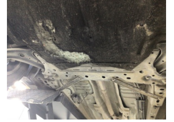
Motor, Alt muhafaza > Deforme Olmuş