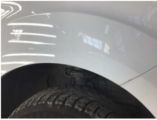
Çamurluk, sağ, Çamurluk, sağ > Noktasal Ezik