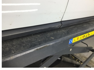
Marşbiyel, sağ, Marşbiyel plastiği, sağ > Çizik