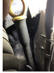
Motor, Motor üst kapağı, plastik > Yağ Kaçağı