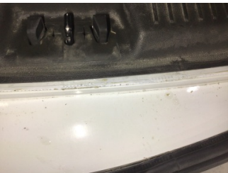
Arka bölüm, Arka sac/panel > Ezik