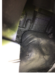
Motor, Motor üst kapağı, plastik > Yağ Kaçağı