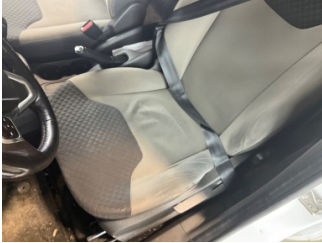
Koltuklar, ön, Koltuk döşemesi, sol ön > Deforme Olmuş