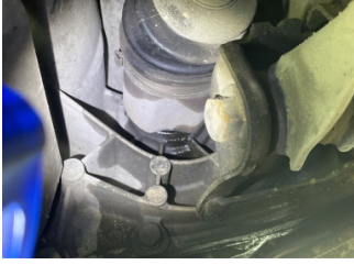
Ön aks, Aks mili, sol > Yağ Kaçağı

Sayfa: 9/11 Araç Çıkış Tarihi: 15.01.2025 14:47