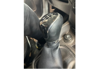
Şanzıman, Vites topuzu > Deforme Olmuş