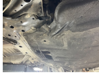
Motor, Alt muhafaza > Hasarlı