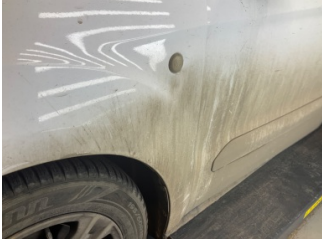
Çamurluk, sol, Çamurluk, sol > Hasarlı