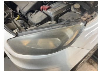
Farlar, Far, sol > Hasarlı