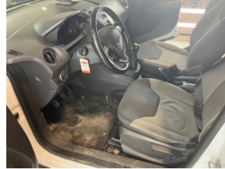
Döşemeler/Kapaklar, Döşemeler/Kapaklar > Kirlenmiş