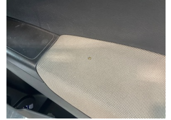
Döşemeler/Kapaklar, Kapı döşemesi, sağ ön > Yakıcı Madde Ile Zarar Görmüş