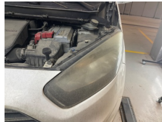
Farlar, Far, sol > Deforme Olmuş