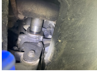
Ön aks, Aks mili, sağ > Yağ Kaçağı