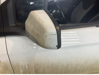
Dikiz aynası, sol, Dış dikiz aynası > Çizik