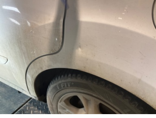
Çamurluk, sol arka, Çamurluk, sol arka > Ezik