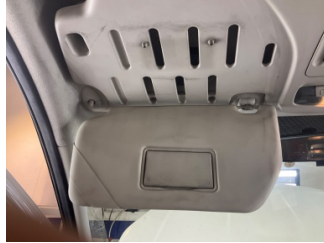
Döşemeler/Kapaklar, Döşemeler/Kapaklar > Kirlenmiş