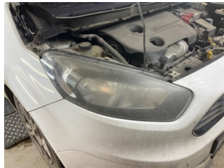
Farlar, Far, sağ > Deforme Olmuş