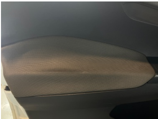
Döşemeler/Kapaklar, Kapı döşemesi, sol ön > Deforme Olmuş