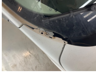
Çamurluk, sağ, Amblem > Eksik