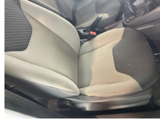
Koltuklar, ön, Koltuk döşemesi, sağ ön > Deforme Olmuş