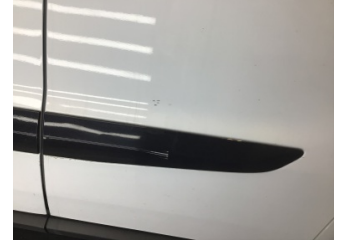
Kapı, sol ön, Kapı bandı > Çizik