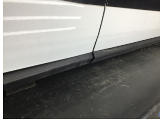
Marşbiyel, sağ, Marşbiyel plastiği, sağ > Ayarsız