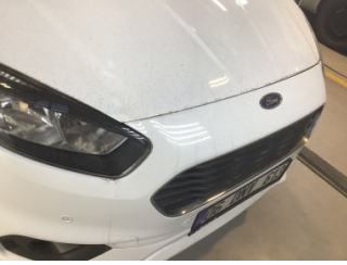
Tampon, ön, Ön tampon > Ayarsız