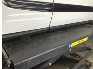
Marşbiyel, sağ, Marşbiyel plastiği, sağ > Çizik