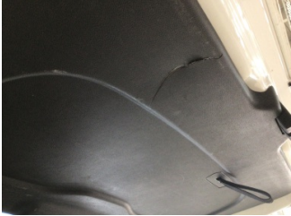
Döşemeler/Kapaklar, Bagaj kapağı, iç döşemesi > Çizik