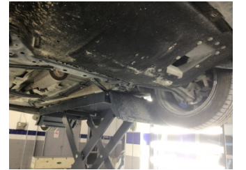
Motor, Alt muhafaza > Deforme Olmuş