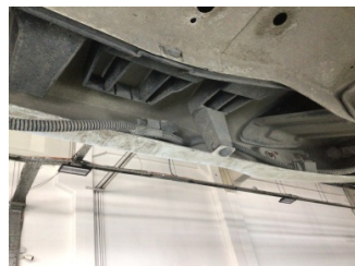
Tampon, arka, Bağlantı ayağı > Hasarlı