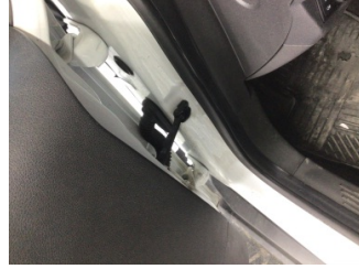
Kapı, sol ön, Kapı gergisi > Ses Yapıyor