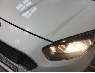
Tampon, ön, Ön tampon > Ayarsız