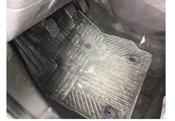
Taban, Paspaslar > Deforme Olmuş