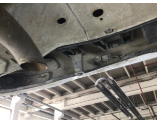
Tampon, arka, Bağlantı ayağı > Hasarlı