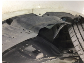
Motor, Alt muhafaza > Hasarlı