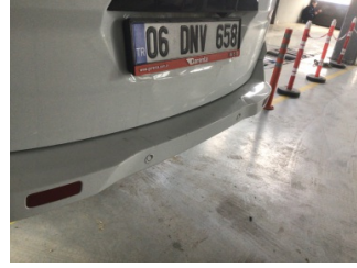
Tampon, arka, Arka tampon > Ezik