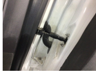
Kapı, sağ ön, Kapı gergisi > Ses Yapıyor