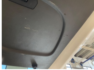
Döşemeler/Kapaklar, Döşemeler/Kapaklar > Çizik