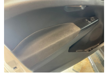
Döşemeler/Kapaklar, Döşemeler/Kapaklar > Deforme Olmuş