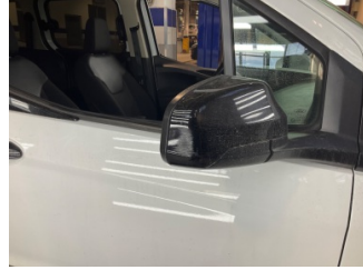
Dikiz aynası, sağ, Dış dikiz aynası > Çizik