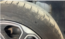
Lastik, sol ön > Hasarlı