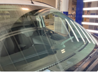
Camlar, Ön cam > Taş izi