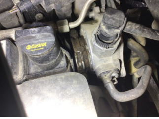
Motor, Motor üst kapağı, plastik > Yağ Kaçığı