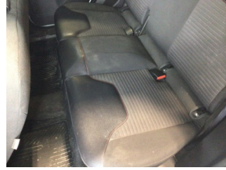
Koltuklar, arka, Arka koltuk > Kirlenmiş