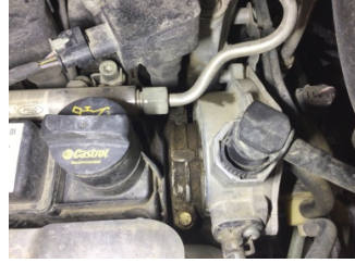
Motor, Motor üst kapağı, plastik > Yağ Kaçığı