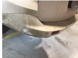
Tampon, arka, Arka tampon > Hasarlı