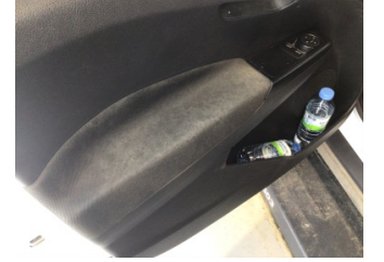
Döşemeler/Kapaklar, Kapı döşemesi, sol ön > Kirlenmiş