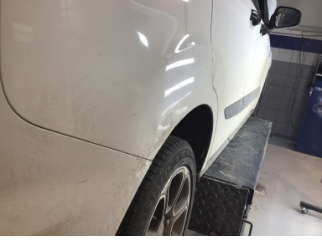
Çamurluk, sağ arka, Çamurluk, sağ arka > Ezik