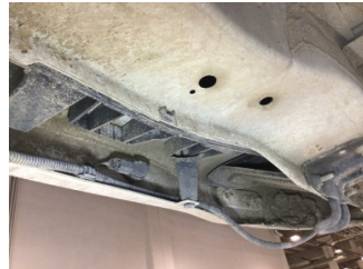
Tampon, arka, Bağlantı ayağı > Hasarlı