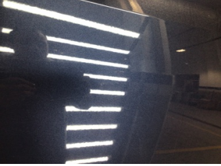
Kapı, sağ ön, Kapı, sağ ön > Çizik