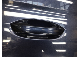
Kapı, sağ ön, Kapı kolu, dış > Çizik