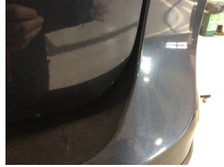
Bagaj kapağı/kapısı, Bagaj kapısı > Çizik