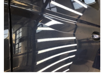
Kapı, sağ arka, Kapı, sağ arka > Çizik