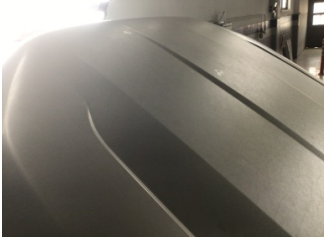
Motor kaputu, Motor kaputu > Solmuş

Sayfa: 1/1 Araç Çıkış Tarihi: 18.11.2024 14:05