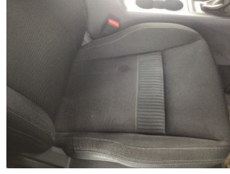
Koltuklar, ön, Koltuk, sağ ön > Kirlenmiş