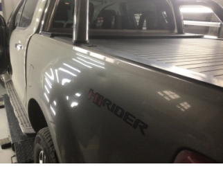
Çamurluk, sol arka, Çamurluk, sol arka > Ezik