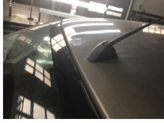
Tavan, Tavan > Ezik