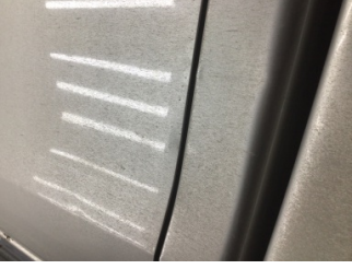
Kapı, sol arka, Kapı, sol arka > Ezik