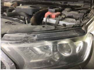
Farlar, Far camı, sol > Solmuş