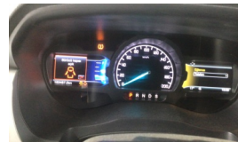
Tekerlek/Lastik > Uyarı Lambası Yanıyor