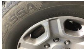
Jant, sağ ön > Çizik