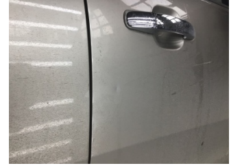
Kapı, sağ ön, Kapı, sağ ön > Noktasal Ezik