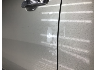
Kapı, sol ön, Kapı, sol ön > Noktasal Ezik