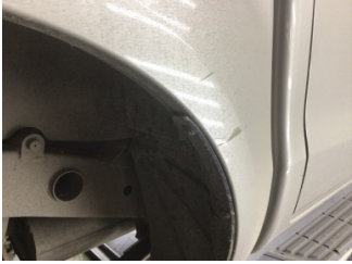
Çamurluk, sağ arka, Çamurluk, sağ arka > Çizik