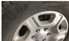
Jant, sağ arka > Çizik