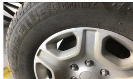
Jant, sol arka > Çizik