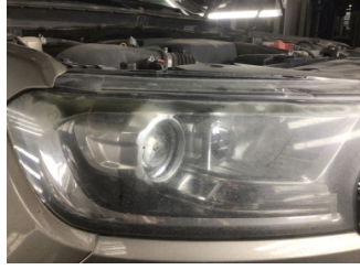
Farlar, Far camı, sağ > Solmuş