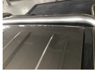
Tavan, Tavan > Ezik