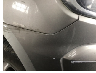
Tampon, ön, Ön tampon > Ayarsız