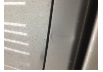
Kaporta, C-direk, sol > Ezik