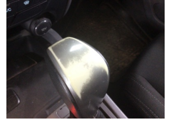
Şanzıman, Vites topuzu > Deforme Olmuş