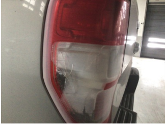
Arka lambalar, Arka lambalar, sol > Hasarlı