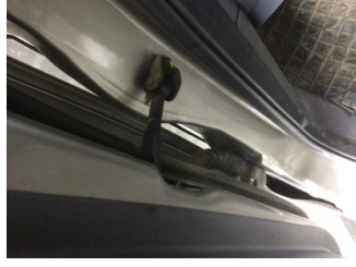
Kapı, sol ön, Kapı gergisi > Ses Yapıyor