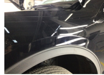
Çamurluk, sol, Çamurluk, sol > Çizik