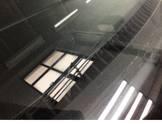
Camlar, Ön cam > Taş Vuruğu