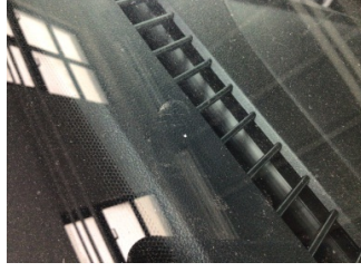
Camlar, Ön cam > Taş Vuruğu