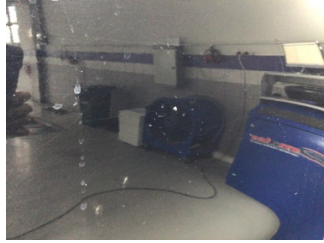
Kapı, sağ ön, Kapı, sağ ön > Çizik