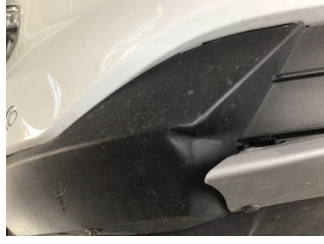
Tampon, ön, Ön tampon > Ezik