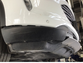
Tampon, ön, Spoiler > Hasarlı