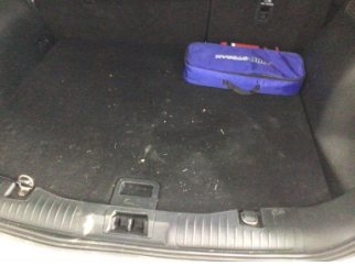
Arka bölüm, Döşeme > Kirlenmiş