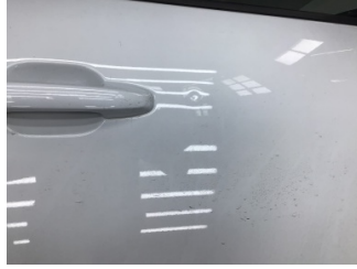
Kapı, sağ ön, Kapı, sağ ön > Noktasal Ezik