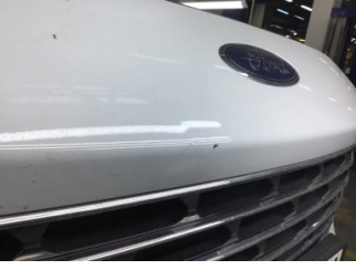
Tampon, ön, Ön tampon > Ezik