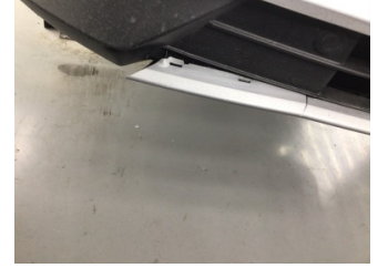
Tampon, ön, Spoiler > Hasarlı