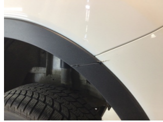
Tampon, arka, Arka tampon > Çizik