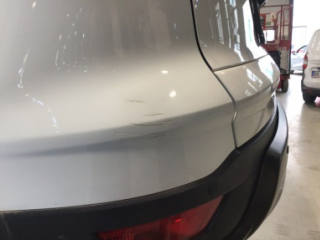
Tampon, arka, Arka tampon > Çizik