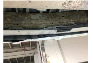
Tampon, arka, Spoyley > Hasarlı