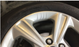
Jant, sağ arka > Çizik