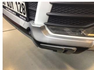
Tampon, ön, Spoyley > Hasarlı