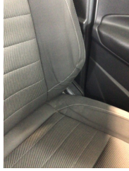
Koltuklar, ön, Koltuk döşemesi, sol ön > Deforme Olmuş