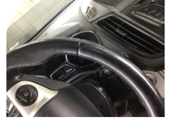
Direksiyon sistemi, Direksiyon simidi > Deforme Olmuş