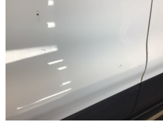
Kapı, sol ön, Kapı, sol ön > Çizik