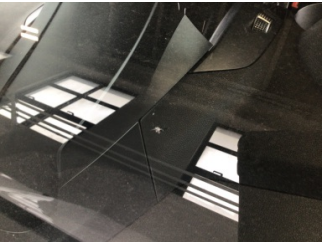
Camlar, Ön cam > Taş Vuruğu