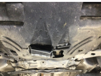
Motor, Alt muhafaza > Hasarlı