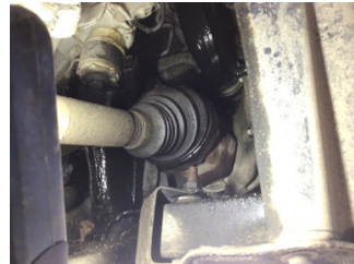
Motor, Turbo hortumları > Yağ Kaçağı