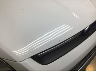
Motor kaputu, Motor kaputu > Taş İzi