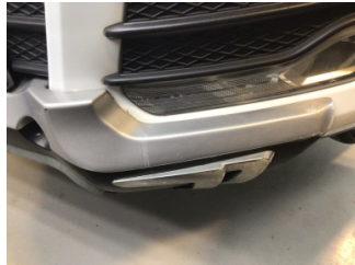
Tampon, ön, Spoyley > Boyalı