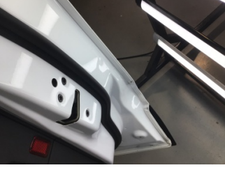
Kapı, sağ ön, Kapı, sağ ön > Ezik