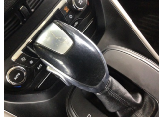
Şanzıman, Vites topuzu > Deforme Olmuş