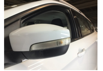
Dikiz aynası, sol, Dış dikiz aynası > Çizik