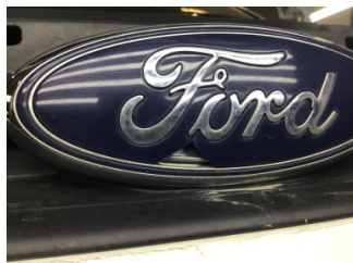
İlave parçalar, ön, Ön panjur > Hasarlı