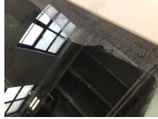
Camlar, Ön cam > Taş izi