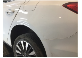
Çamurluk, sol arka, Çamurluk, sol arka > Noktasal Ezik