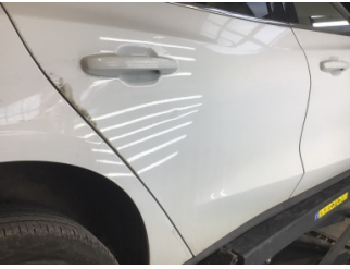
Kapı, sağ arka, Kapı, sağ arka > Noktasal Ezik