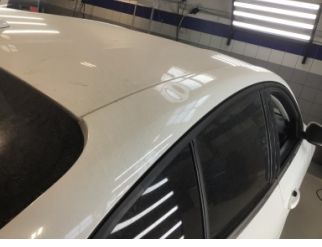
Tavan, Sağ üst frangart > Ezik