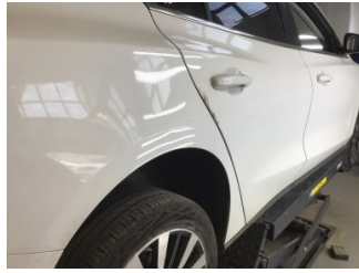
Çamurluk, sağ arka, Çamurluk, sağ arka > Noktasal Ezik