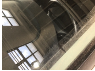
Camlar, Ön cam > Taş izi