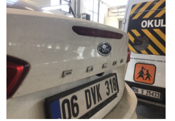
Bagaj kapağı/kapısı, Bagaj kapısı > Noktasal Ezik