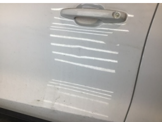
Kapı, sol ön, Kapı, sol ön > Noktasal Ezik