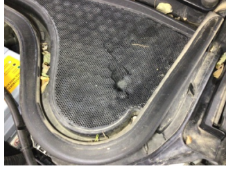
Camlar, Alt Izgara > Hasarlı