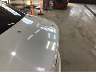
Bagaj kapağı/kapısı, Bagaj kapısı > Noktasal Ezik