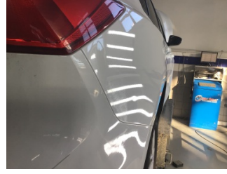
Çamurluk, sağ arka, Çamurluk, sağ arka > Noktasal Ezik