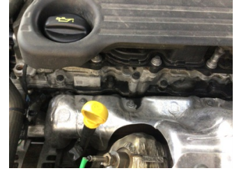
Motor, Motor üst kapağı, plastik > Yağ Kaçağı