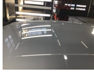
Tavan, Tavan > Noktasal Ezik