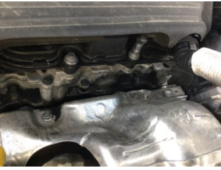
Motor, Motor üst kapağı, plastik > Yağ Kaçağı