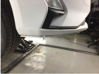
Tampon, ön, Spoiler > Sökülmüş-Yok