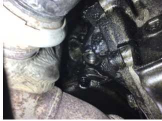
Motor, Silindir kapağı > Yağ Kaçağı