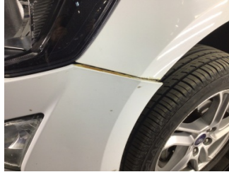
Tampon, ön, Ön tampon > Standart Dışı Onarım