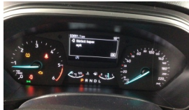
Tekerlek/Lastik > Uyarı Lambası Yanıyor