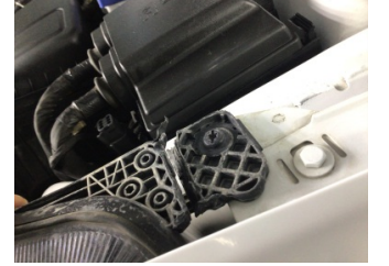
Farlar, Far, sol > Hasarlı