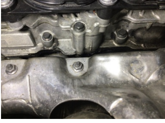
Motor, Motor üst kapağı, plastik > Yağ Kaçağı

Sayfa: 10/11 Araç Çıkış Tarihi: 09.12.2024 16:47