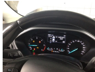
Motor, Motor > Uyarı Lambası Yanıyor