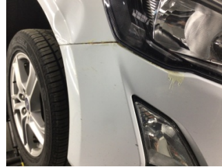
Tampon, ön, Ön tampon > Standart Dışı Onarım