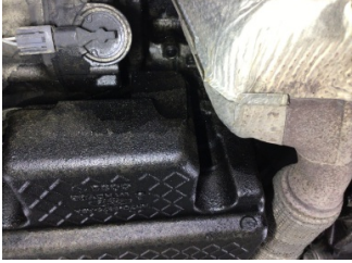
Motor, Yağ karteri contası > Yağ Kaçağı