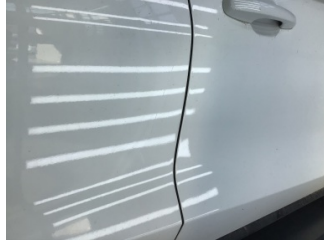
Kapı, sağ arka, Kapı, sağ arka > Çizik