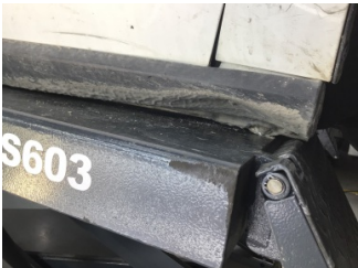
Marşbiyel, sağ, Marşbiyel plastiği, sağ > Hasarlı