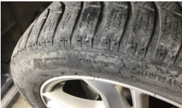
Lastik, arka > Deforme Olmuş