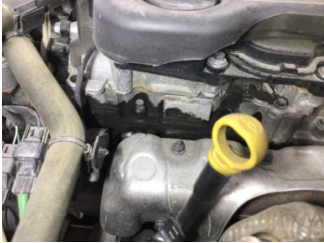
Motor, Motor üst kapağı, plastik > Yağ Kaçağı