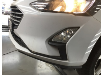
Tampon, ön, Ön tampon > Çizik