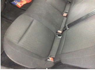
Koltuklar, arka, Arka koltuk > Kirlenmiş