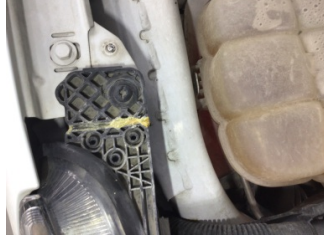
Farlar, Far, sağ > Standart Dışı Onarım