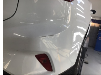
Tampon, arka, Arka tampon > Çizik