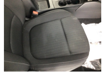
Koltuklar, ön, Koltuk, sağ ön > Kirlenmiş