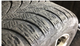
Lastik, ön > Deforme Olmuş