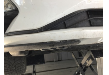
Tampon, ön, Spoiler > Ayarsız