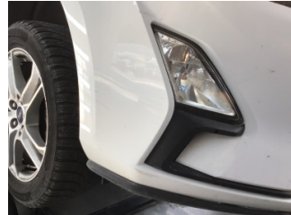
Tampon, ön, Ön tampon > Çizik