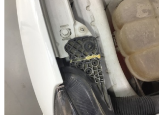
Farlar, Far, sağ > Standart Dışı Onarım