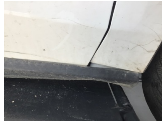
Çamurluk, sağ, Çamurluk, sağ > Hasarlı