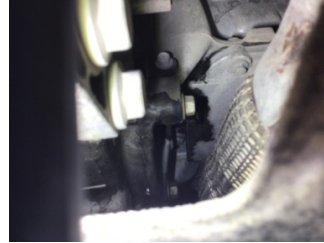
Şanzıman, Şanzıman > Yağ Kaçağı