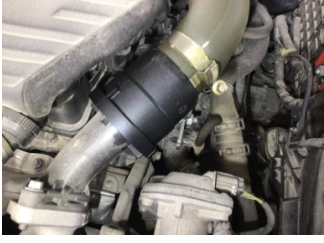
Motor, Turbo hortumları > Yağ Kaçağı

Sayfa: 1/1 Araç Çıkış Tarihi: 04.11.2024 10:04