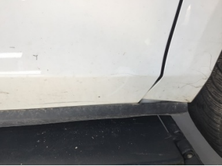
Kapı, sağ ön, Kapı, sağ ön > Çizik