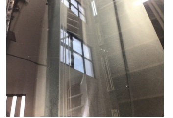
Camlar, Ön cam > Taş Vuruğu