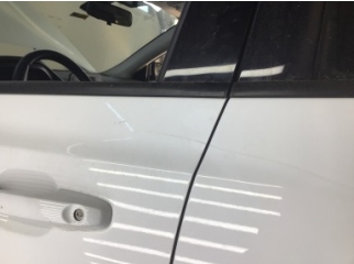
Kapı, sol ön, Kapı, sol ön > Çizik