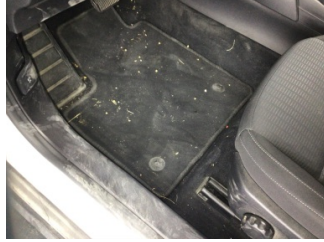
Taban, Taban halısı > Kirlenmiş