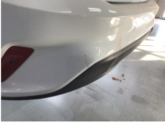
Tampon, arka, Arka tampon > Ezik