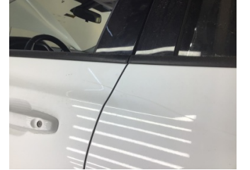
Kapı, sol arka, Kapı, sol arka > Çizik