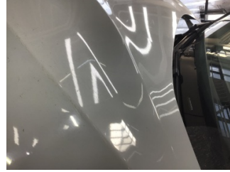
Motor kaputu, Motor kaputu > Noktasal Ezik