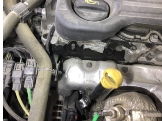
Motor, Motor üst kapağı, plastik > Yağ Kaçağı