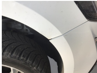
Tampon, ön, Ön tampon > Ayarsız