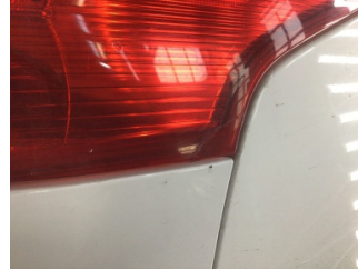
Arka lambalar, Arka lambalar, sağ > Hasarlı