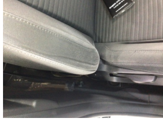
Koltuklar, ön, Koltuk, sağ ön > Deforme Olmuş