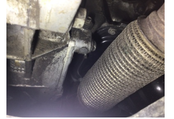
Motor, Yağ karteri contası > Yağ Kaçağı