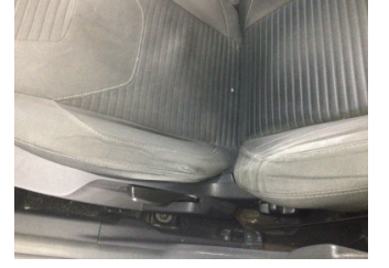
Koltuklar, ön, Koltuk, sol ön > Deforme Olmuş