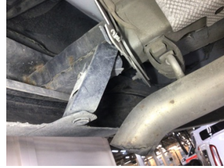
Tampon, arka, Bağlantı ayağı > Hasarlı