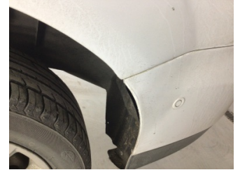
Tampon, arka, Arka tampon > Ayarsız