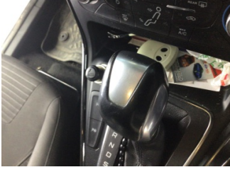
Şanzıman, Vites topuzu > Deforme Olmuş

Sayfa: 8/9 Araç Çıkış Tarihi: 20.12.2024 14:28