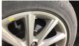
Jant, sağ ön > Çizik