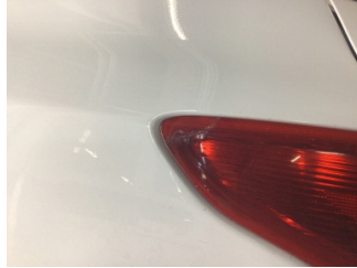
Arka lambalar, Arka lambalar, sol > Hasarlı