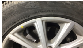
Jant, sağ ön > Çizik