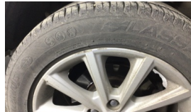
Jant, sol arka > Çizik