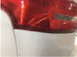
Arka lambalar, Arka lambalar, sol > Hasarlı