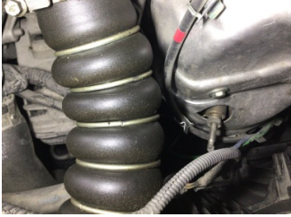
Motor, Turbo hortumları > Yağ Kaçağı