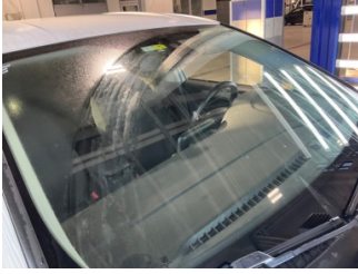
Camlar, Ön cam > Taş İzi