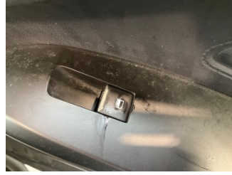
Kapı, sağ ön, Cam/Ayna/Koltuk kumanda tuşları > Deforme Olmuş