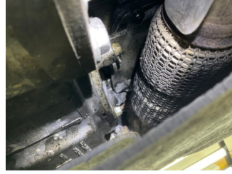
Motor, Motor > Yağ Kaçağı