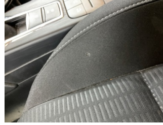
Koltuklar, ön, Koltuk döşemesi, sağ ön > Yakıcı Madde ile Zarar Görmüş