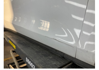
Kapı, sağ ön, Kapı, sağ ön > Hasarlı