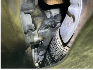
Motor, Motor > Yağ Kaçağı